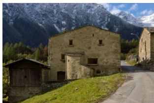
Das Steinhaus von aussen La maison en pierres, vue de l'extérieur