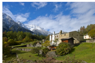
Weiler Garbela oberhalb Brusio Hameau de Garbela au-dessus de Brusio

Das Puschlaver Bauernhaus oberhalb Brusio GR ist das fünfte Baudenkmal, das über die Stiftung Ferien im Baudenkmal gemietet werden kann. Bis zu sechs Personen können nun zeitgenössisches Wohnen innerhalb alter Gemäuer erleben.