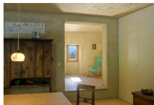
Essraum und Stube Chambre à manger et séjour

Une ferme traditionnelle de la Vallée de Poschiavo située sur les hauts de Brusio GR est la cinquième maison historique de la Fondation Vacances au cœur du patrimoine. Jusqu'à six personnes peuvent conjurer ici séjour dans de vieux murs et confort moderne.