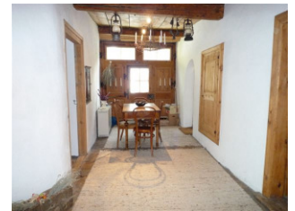
„Piertan“ mit Esstisch „Piertan“ mit Esstisch