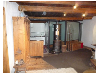
Gang mit neuem Bad Gang mit neuem Bad